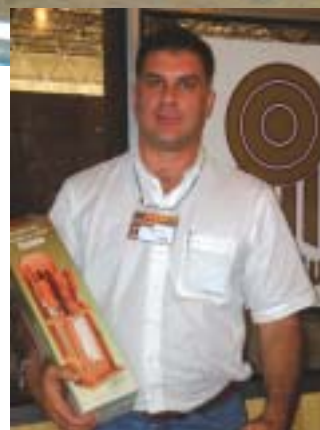
Muita qualidade deu o brilho da raça na Feicorte 2007