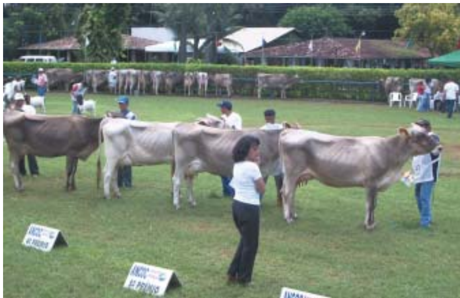
A mostra de Parnamirim (RN) reuniu o maior número de animais no período